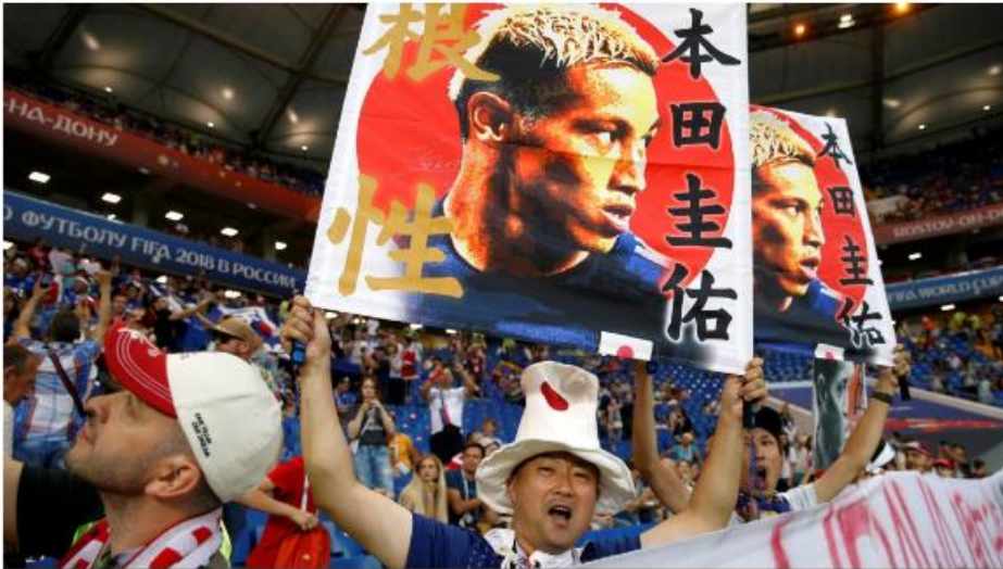
FILE PHOTO: Soccer Football - World Cup - Round of 16 - Belgium vs Japan - Rostov Arena, Rostov-on-Don, Russia - July 2, 2018 Japan fan holds up a picture of Keisuke Honda inside the stadium before the match REUTERS/Marko Djurica/File Photo